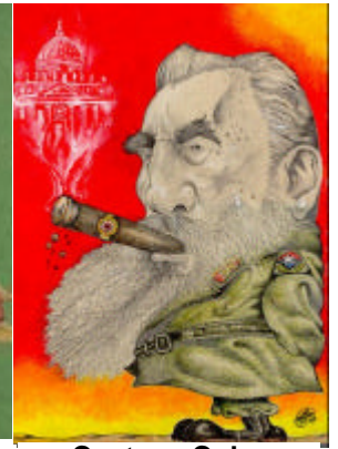
Castro - Cuba