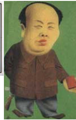
Mao - China