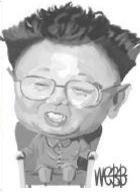
Kim Jong Il - North Korea