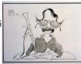
Ortega - Nicaragua