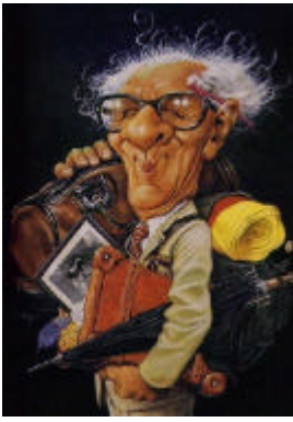
Honecker - RDA